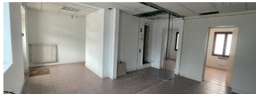
Les anciens locaux de la Poste se transforment petit à petit et accueilleront Julie, votre nouvelle coiffeuse, sans doute à partir de décembre.

■ Parmi les priorités, 50 000 € ont donc été inscrits au budget afin de transformer l'ancien local de la Poste en local commercial. Cette enveloppe permettra également de faire face aux aléas, fréquents dans les vieux bâtiments, à l'image du remplacement de plusieurs poutres sur la façade arrière. Les agents municipaux ont d'ores et déjà procédé au démontage du comptoir. Les prochaines étapes consistent à remettre le bâtiment aux normes (électricité, plomberie, sécurité incendie) afin de permettre l'installation du futur salon de coiffure. À noter qu'après négociation, La Poste a accepté de contribuer à la remise en état du bâtiment à hauteur de 22 000 €.