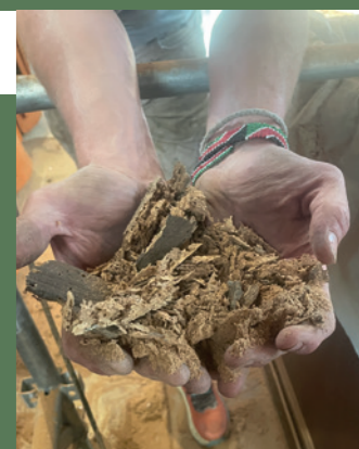
100 litres de produit de traitement ont été appliqués