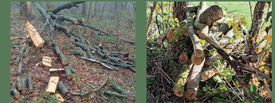
Sur les deux sites plusieurs stères ont été coupés sans autorisation.

La municipalité a récemment constaté plusieurs cas de coupes de bois non autorisées sur des terrains communaux, notamment dans les anciennes carrières et les bois. Nous rappelons que ces pratiques sont strictement interdites. Le prélèvement de bois sans autorisation constitue un vol, passible de sanctions prévues par le Code pénal. En cas de récidive, la municipalité se réserve le droit de déposer plainte.