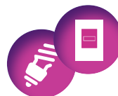
AMPOULES FLUOCOMPACTES / COMPTEUR LINKY 87 V/m